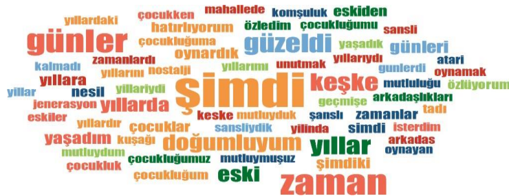
Şekil 1. Kullanıcıların Verdiği Yanıtlara Göre Çıkarılan Kelime Bulutu 4

YouTube yorumlarının analizi kendi içerisinde bir tipoloji oluşturmaktadır. Analiz kapsamında öncelikle YouTube videosu ve videoya gelen yorumlara ön inceleme yapılmıştır. Kullanıcı üretimine dayalı olarak video altına girilen yorumların meydana getirdiği kolektiflik etkisini içerecek alan notları alınmıştır. Buna bağlı olarak araştırmanın birinci aşamasında ön inceleme ve alınan notlar paralelinde, öncelikle yorumlarda geçen kelimelerin yoğunluğuna bağlı olarak Şekil 1'de görüldüğü üzere kelime bulutu oluşturulmuştur. Oluşturulan kelime bulutuna göre, videoyu deneyimleyen kullanıcıların anlamlandırma şekilleri belirlenmeye çalışılarak kategoriler oluşturulmuştur.